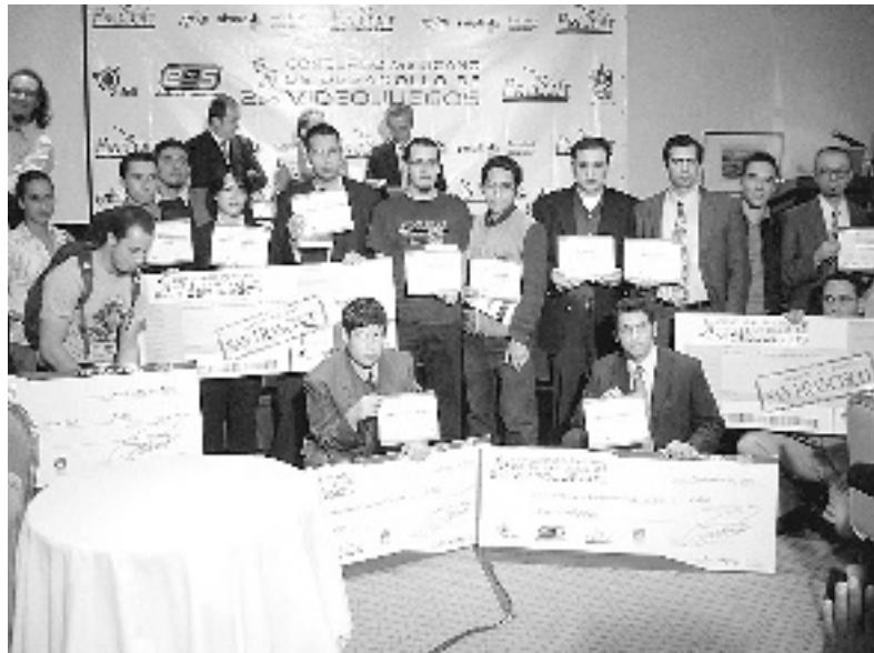
► Cheques por 4 mil pesos, paquetes de Autodesk y la participación en el 2007 durante el Game Developers Conference, en San Francisco, fueron algunos de los reconocimientos.

Ambos, fieles al sistema operativo Java Micro Edition, decidieron